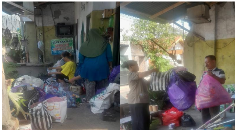
Gambar 2. Kondisi Bank Sampah RT 04 Kelurahan Rejomulyo

Kelurahan Rejomulyo, yang terletak di Kecamatan Kota, Kota Kediri, merupakan wilayah permukiman urban dengan kepadatan penduduk yang menghasilkan timbunan sampah rumah tangga harian secara signifikan. Pengelolaan sampah di wilayah ini telah mengalami transisi dari pendekatan konvensional menuju model partisipatif melalui inisiasi Bank Sampah "Berkah Mizbah", yang secara resmi dikukuhkan melalui Surat Keputusan Kepala Kelurahan Rejomulyo Nomor 188.4/14/419/2018. Lokasi sekretariat di Jalan Ngasinan RT. 03 RW. 04 berfungsi sebagai pusat operasional meliputi titik kumpul, pemilahan, penimbangan, dan pencatatan transaksi dengan kondisi seperti pada Gambar 2. Partisipasi masyarakat menjadi fondasi utama program ini, dengan keterlibatan 34 anggota terdaftar yang bergabung secara bertahap sejak Juli 2014 hingga Agustus 2022. Komposisi peserta didominasi oleh ibu rumah tangga, pemuda, dan pengurus RT/RW, yang secara kolektif menunjukkan kesadaran lingkungan dan dukungan struktural dari tingkat kelurahan hingga rukun tetangga dalam mendorong tata kelola sampah berkelanjutan.